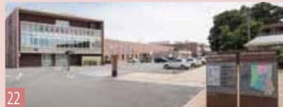
学校法人 国際医療福祉大学 国際医療福祉大学市川病院 (260床) 千葉県市川市国府台 6-1-14