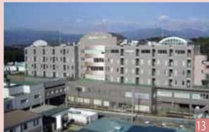
学校法人 国際医療福祉大学 国際医療福祉大学病院 (353床) 栃木県那須塩原市井口537-3