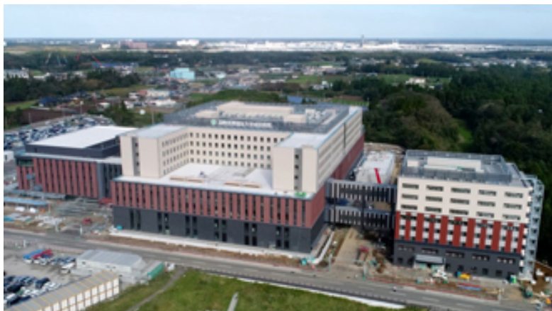
病院概観(2019年10月撮影)