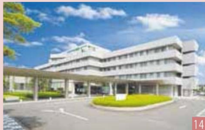
学校法人 国際医療福祉大学 国際医療福祉大学塩谷病院 (240床) 栃木県矢板市富田77