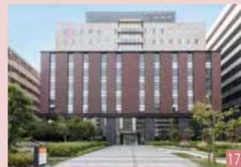
学校法人 国際医療福祉大学 国際医療福祉大学 三田病院 (291床) 東京都港区三田1-4-3