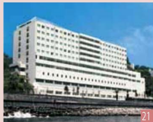
学校法人 国際医療福祉大学 国際医療福祉大学 熱海病院 (269床) 〈国際医療福祉大学大学院 熱海キャンパス併設〉 静岡県熱海市東海岸町13-1