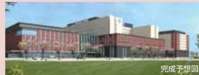
学校法人 国際医療福祉大学 国際医療福祉大学成田病院 千葉県成田市畑ケ田 ※2020年新設(642床)