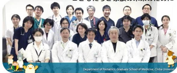
Department of Pediatrics, Graduate School of Medicine, Chiba University

学内には豊富な指導医が揃っています 血液腫瘍 感染症 内分泌・代謝 免疫・アレルギー 循環器 神経 新生児 遺伝子診療 児童虐待