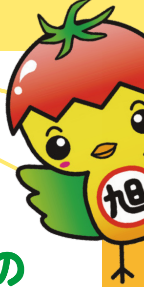
旭市イメージアップ キャラクター あさピー