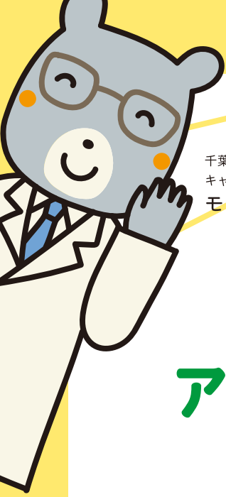
千葉大学病院公式 キャラクター モモンガ先生