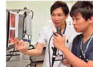
いのちなHarmony 2019.9 Vol.57