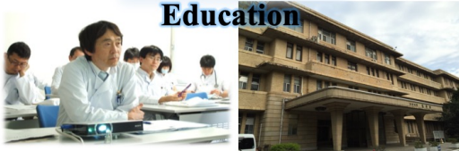
千葉大学呼吸器内科HP